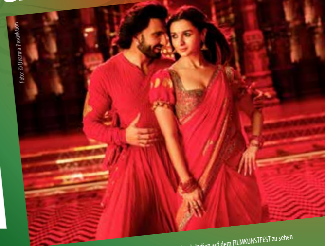
ROCKY AND RANI'S LOVE STORY ist im Filmprogramm des Gastlands Indien auf dem FILMKUNSTFEST zu sehen

VERANSTALTUNGEN RUND UM DAS GASTLAND INDIEN FILMKUNSTFEST MECKLENBURG-VORPOMMERN 06.05.-11.05.25 SCHWERIN